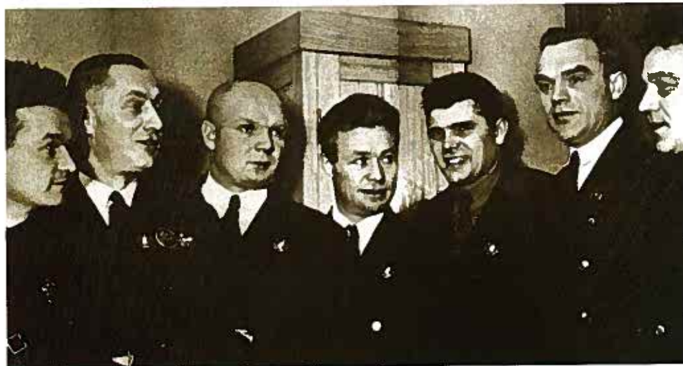
Первые Герои Советского Союза — летчики: А.В. Ляпидевский, С.А. Леваневский, М.В. Водопьянов, В.С. Молоков, И.В. Доронин, М.Т. Слепнев, Н.П. Каманин (справа налево)

К 1991 г. звания Героя Советского Союза удостоено 12 772 человека, из которых 154 человек награждены двумя медалями «Золотая Звезда», 3 человека — тремя медалями «Золотая Звезда» и 2 человека — четырьмя медалями «Золотая Звезда». В числе Героев Советского Союза — 95 женщин, одна награждена дважды; 24 из них получили это высокое звание за партизанскую деятельность.