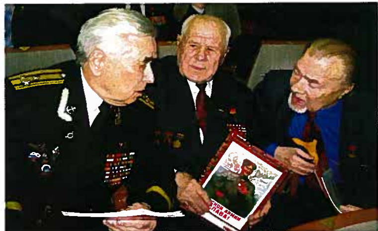
Герои Советского Союза С.Н. Решетов, И.Е. Рыжков, М.Ф. Борисов

Президент фонда поддержки Героев В.В. Сивко отметил, обращаясь к школьникам, «вам повезло, что вы можете так близко пообщаться с людьми, удостове-