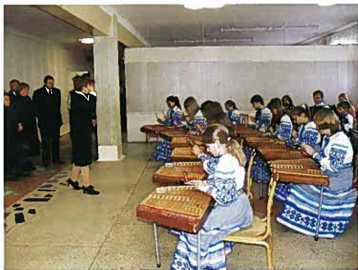
Ученицы школы № 29 г. Витебска приветствуют гостей

Перед открытием памятной плиты на здании школы прошел торжественный митинг, в котором принимали участие представители администрации города, воины-афганцы, руководители городской организации «Братство», сотрудники Витебского городского музея воинов-интернационалистов, военнослужащие 103-й мобильной десантной бригады, педагоги, учащиеся. Открывал памятную плиту старший сын героя