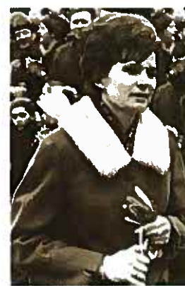
Первая в мире женщина-космонавт — Герой Советского Союза, Валентина Владимировна Терешкова.

Совсем недавно Валентина Владимировна праздновала свой юбилей, который не остался незамеченным всей страной, а Президент РФ В.В. Путин так охарактеризовал заслуги первой женщины-космонавта: « Ваш полет в космос всегда был и остается предметом гордости и для советского, и для российского народов ». Президент РФ наградил Валентину Владимировну орденом «За заслуги перед Отечеством» второй степени. С юбилеем Вас Валентина Владимировна!