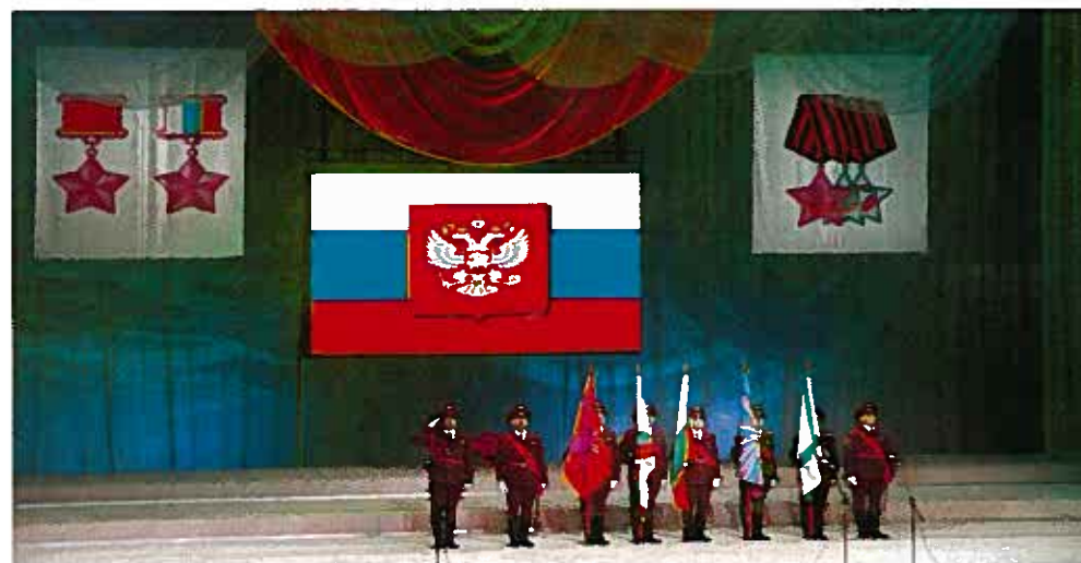
Празднование 15-летия Российской Ассоциации Героев в Центральном академическом театре Российской Армии 13 апреля 2007 г.

В этих условиях люди, удостоенные наивысшего звания страны, пришли к выводу, что необходимо занять в обществе более активную наступательную позицию, сохраняя непреходящие нравственные ценности, защищая