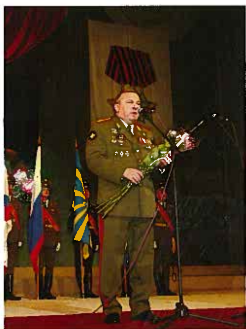
Поздравление Президента Российской Ассоциации Героев Героя РФ В. А. Шаманова

Становление нового молодого самостоятельного государства — Российской Федерации в 90-е годы двадцатого столетия проходило в сложной и противоречивой социально-экономической и общественно-политической обстановке. И это не могло не сказаться на самом уязвимом, молодом поколении граждан России, а прежде всего на его духовности, нравственности, на его гражданственности в широком смысле слова. В подростковой и молодежной среде практически утратили свою актуальность такие ценности, как любовь к Родине и гордость за принадлежность к ней, причастность к защите Отечества. В некоторых средствах массовой информации подвиги людей, удостоенных высшей награды Родины — звания Героя Советского Союза, подвергались шельмованию: сомневались в их необходимости и целесообразности, отрицали их значимость. Огромный потенциал тысяч Героев Советского Союза и Героев Российской Федерации не востребован государством и обществом в патриотическом воспитании подрастающего по-